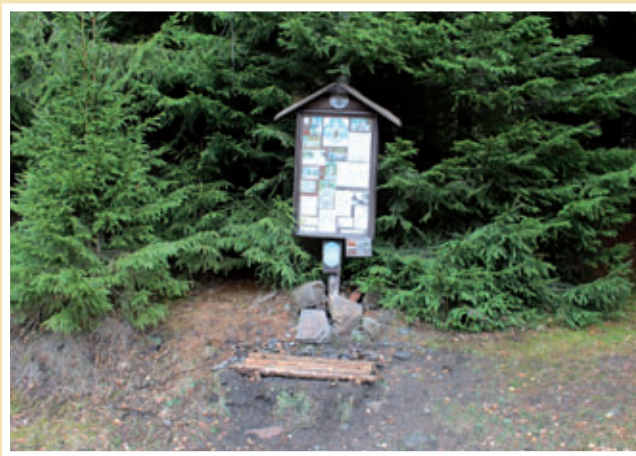
Skautská nástěnka vedle mohyly na Eliáši (2017).