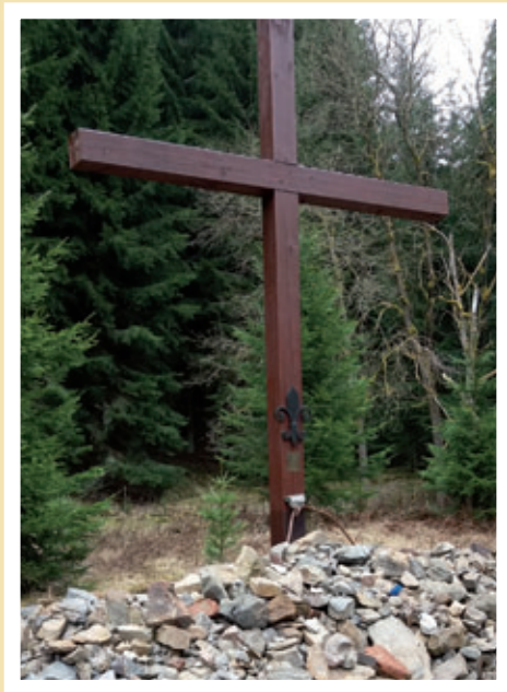
Skautská mohyla Eliáš (2018).

nové byli v politických procesech odsouzeni na mnoho let vězení a byli nasazeni v jáchymovských uranových dolech na nucenou práci. Během Pražského jara byl skauting krátce znovu povolen v letech 1968–1970 a pak opět zakázán. Od roku 1992 se na Jáchymovsku vzpomíná prostřednictvím dřevěného kříže na mohyle Eliáš na skauty zavřené v uranových pracovních táborech a dolech. Naposledy v roce 2013 byl kříž obnoven.