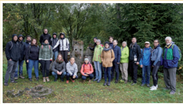
Čeští a němečtí účastníci zapojení do projektu „Learning from the Past: How to Mediate Historical Topics in Civic Education“ (2019).