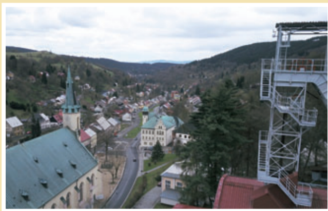
Pohled na Jáchymov (2018).

ve městě se tento počet přiblížil někdejší slávě stříbrného města. Rozdíl spočíval v trochu modernějších těžebních postupech a také v tom, že většina jáchymovských horníků zde po r. 1939 těžila uran a nikoli blyštivý mincovní kov. Šlo často (ale zdaleka ne výlučně) o horníky z donucení, válečné, retribuční, kriminální a politické vězně, kteří obývali zdejší trestanecké lágry pod pohružkou zastřelení. Během druhé světové války a zejména krátce po ní se začala psát nechvalně známá kapitola jáchymovského gulagu s až dvanácti trestaneckými pracovními tábory při uranových dolech. Otrocké lágry a polovojenské pásmo bohužel slávu a zajímavost města a okolí na dlouho zastínily a odřízly od už tak hodně pokřiveného vývoje v ostatním pohraničí.