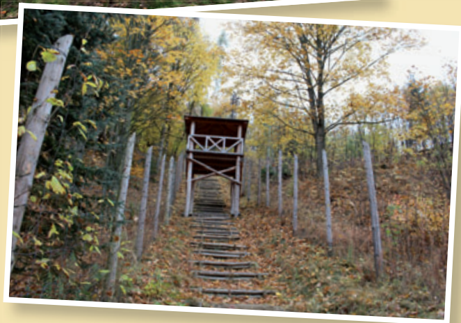
Mauthausenské schody před rekonstrukcí v r. 2014 a opravené schody v roce 2018.