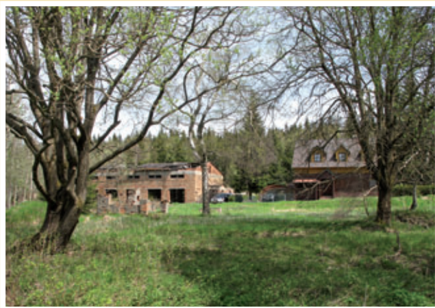
Hornická převlékárna na Rovnosti.