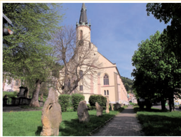
Vzpomínkové místo před kostelem sv. Jáchyma v r. 2015.

U památníku „Křížová cesta ke svobodě“ se každý rok koná vzpomínkový ceremoniál dosud žijících pamětníků z ČR i Slovenska. Od roku 1990 se zde muklové setkávají vždy poslední květnovou sobotu s politickými představiteli a zástupci médií při vzpomínkové bohoslužbě v kostele a následujícím ceremoniálu, který se nazývá „Jáchymovské peklo“. Při této příležitosti se k památníku kladou věnce, hraje vojenská hudba a pronáší se politické projevy v duchu hesla „vzpomeňme a nezapomeňme“. Z tohoto důvodu Jáchymov